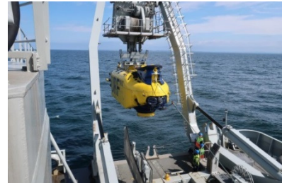
Inom ramen för ubåtsräddningsavtalet mellan Sverige och Nederländerna, genomfördes en gemensam ubåtsräddningsövning på västkusten.