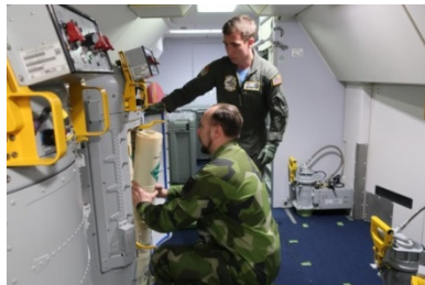
Amerikanska ubåtsjaktplanet Poseidon P-8, deltog i årets ubåtsjaktövning. Med deras aktiva och passiva spaningssonarer utgjorde de ett bra komplement till ubåtsjakten.