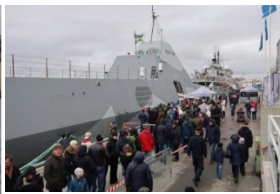
Besöksdagen under övningen på västkusten visade på att det finns ett försvarsintresse. Vi hade flera tusen besökare, trots kyla och regn.