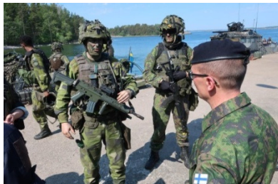
Internationella samarbeten kommer fortsatt att ha stort fokus.