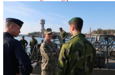
Chefen för andra flottan, besökte marinen under våren för att bland annat diskutera fortsatt samarbete och BALTOPS19.