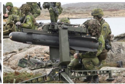
I samband med övningen på västkusten, genomfördes beredskapskontroll på amfibiebataljonen.