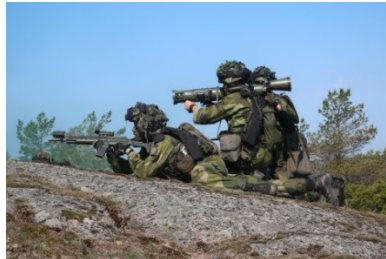
Amfibiebataljonen deltog på den finska slutövningen som en del i det svenskfinska samarbetet.