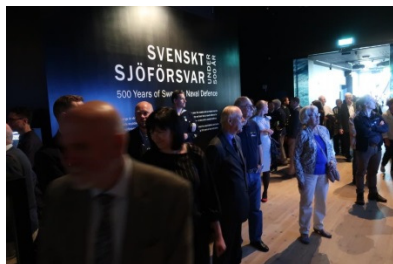
Efter drygt 1,5 års arbete, invigdes den marina utställningen på Karlskrona museum. Utställningen är en del i firandet av marinen 500 år.