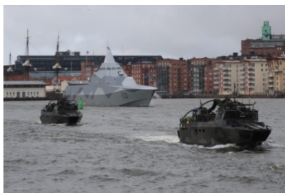
Att synliggöra marinens verksamhet längs Sveriges hela kust, är viktigt.

Genomförd övningsverksamhet har haft stort fokus på internationella samarbeten, då främst med Finland och USA. Internationella samarbeten kommer även i framtiden att ha stort utrymme. Tillsammansperspektivet medför att marinen får möjlighet att öva med kvalificerade enheter som i sin tur utvecklar våra förmågor. Tillsammans med andra skapar vi dessutom stabilitet och säkerhet genom att agera tillsammans i regionen.