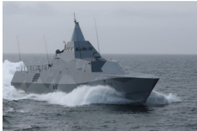
Marin närvaro över tiden är viktigt för att skapa kontroll, för det krävs en ökad numerär.

försvarsbeslut är mycket viktigt och här kommer jag tillsammans med er göra allt jag kan för att fortsätta påverka marinens framtid i rätt riktning.